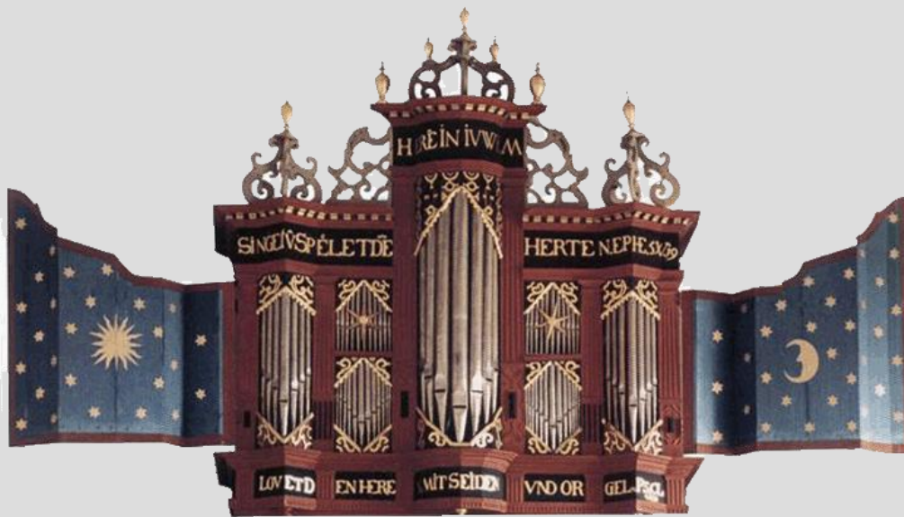
Orgel (1642) in Westerhusen/Ostfriesland