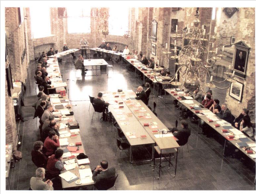
Die Synode tagt zwei Mal im Jahr in Emden